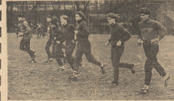
Moment din antrenamentul jucătorilor de la Dynamo Dresda.