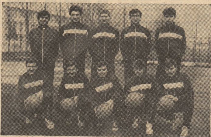
Echipa de baschet va încerca să se impună în lupta pentru calificarea în prima divizie