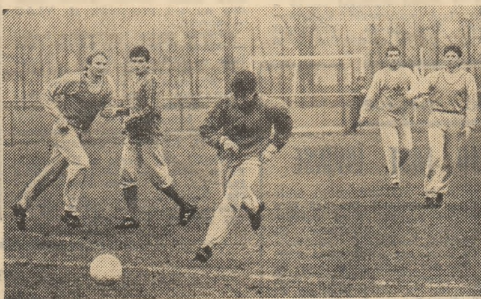
Secvență din antrenamentul de ieri al campioanei noastre

În dorința de a se prezenta în plenitudinea forțelor, I.F.K. Göteborg a efectuat și ea un riguros program de antrenamente, care, în intervalul scurs de la prima manșă și