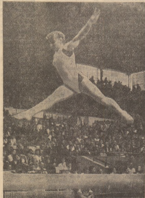
Un moment al „recitalului Silivaș” la birnă