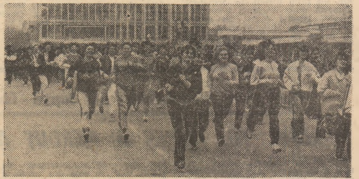
Paralel cu întrecerile de pe „Tineretului”, pe aleile Complexului studențesc de la Grozăvești a avut loc — tot sub însemnele etapei de vară a Daciadei — o amplă competiție de cros organizată de C.U. București