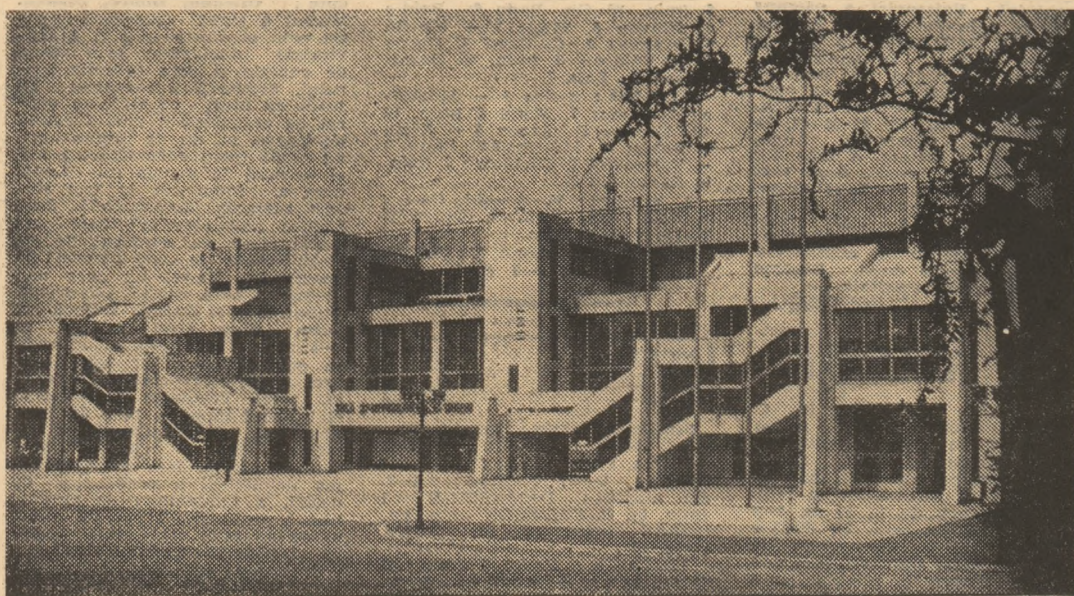
Sala Sporturilor din Buzău, una din frumoasele realizări ale acestei perioade de mari împliniri

sportul —, fapt demonstrat de preocuparea specialiștilor de a trasa în planurile lor construcțiile destinate sportului. Este, în fond, expresia directă a materializării indicațiilor și orientărilor secretarului general al partidului, tovarășul NICOLAE CEAUȘESCU, privind viitoarea înfățișare a localităților patriei, a modului cum trebuie să răspundă ele din toate punctele de vedere, societății de mine, nevoilor crescînde de civilizație și progres.