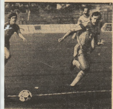
ua au demonstrat că se află prîntre cei tîcîndu-se, din nou, în finala C.C.E.

per-Steaua, acest neii, și ții ale e la namo și