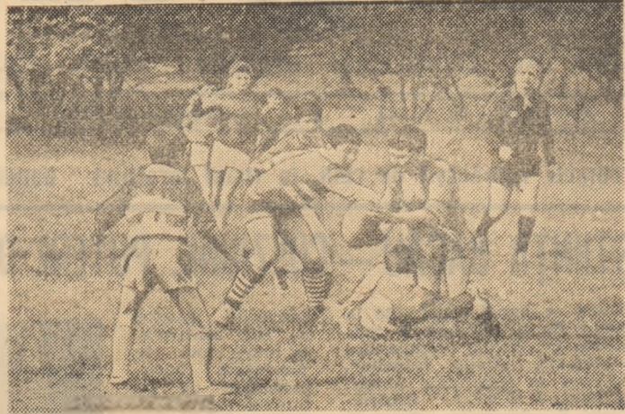
Demonstrațiile de minigrubby au scos în relief pasiunea copiilor pentru acest sport al voințelor

monstrațiile echipelor din Sectorul Agricol Ilfov, cele care au reprezentat comunele Chitila, Dragomirești, Fundeni și Mogoșoaia. Merită toată prețuirea o asemenea inițiativă, pe care prof. C. Lihu, pre-