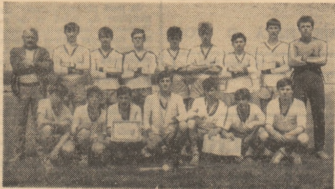
Jucătorii de la Lic. ind. I.I.C. nr. 3. Suceava, dublă laureați în 1989

Cele zece finaliști fiind de forțe sensibile egale, tragera la sorți n-a influențat echilibrul valoric din cele două grupe, astfel că am asistat la partide viu disputate, în care niciuna din protagoniste n-a putut evita... înfrîngerea, unele fiind deparțate în clasamentul preliminarilor de punctaveraj. Cu un plus de tehnică în executarea paselor, ochirea adversarilor și minuirea bastonului, procedeul unde au obținut puncte suplimentare, tinerii de la Liceul industrial I.I.C. nr. 3 Suceava (antrenor — prof. I. Braicu), Liceul agroindustrial Salonta (prof. V. Pantea), Liceul agroindustrial Băilești (prof. Al. Mîloțeanu) și Liceul agroindustrial Bărcănești (maiestru-instructor T. Pisău) s-au calificat în turneul final. Din păcate, în meciul decisiv pentru ocuparea celui de-al patrulea loc, dintre echipa locală și cea din comuna Poarta Albă, ultima a fost sancționată, pe nedrept, de arbitraj cu două puncte, tocmai cînd oaspeții conduceau cu 7-2 și se îndreptau spre turneul final.