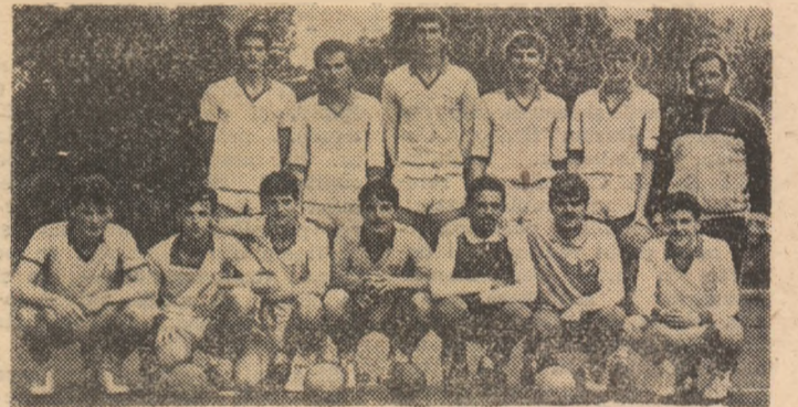
C.S.Ș. Dinamo Brașov, pentru a doua oară campioană