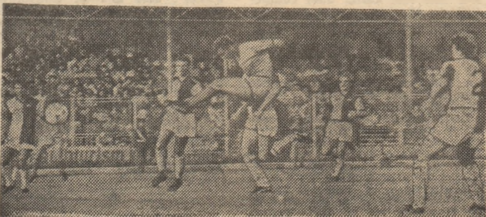
Centrarea lui Dragnea (care nu se vede în fotografie) este re- luată cu capul, în plasă, de Stere, care înscrie al 3-lea gol al echipei Flacăra Moreni în poarta Rapidului.

(Nici nu mai ținem minte de cînd pe tabelul câștigătoarelor a mai figurat și un alt nume de echipă).