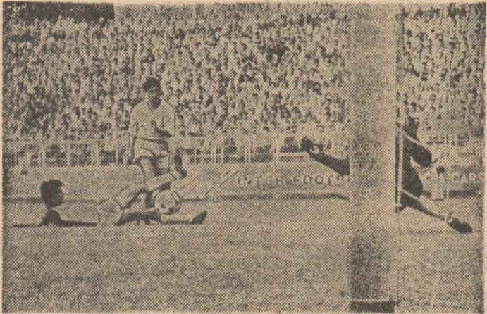
Piturcă a valorificat din plin „unghiurile deschise” ale lui Rada și Barba, marcând al doilea gol

STEUA — RAPID 3-2 (1-1) DINAMO — VICTORIA 2-0 (1-0)