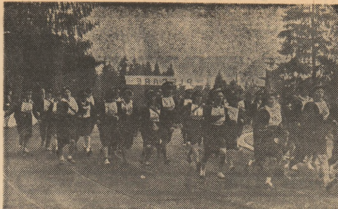
Secvență din întrecerea feminină

Ajuns la cea de-a 13-a ediție și desfășurându-și faza finală în Poiana Brașov, Marșul factorilor poștali, competiție înscrisă sub generoasa emblemă a Daciadei, s-a constituit, și de această dată, într-o veritabilă sărbătoare a sportului, a cîntecului, a drumețiilor. Faptul că, după disputarea celor două probe, am asistat la o foarte frumoasă paradă a portului popular din împrejurimi, apoi, în final, la o uriașă horă în care s-au prins toți concurenții, inclusiv spectatorii din tribune, ne îndreptățește să spunem că, prin eforturile deosebite ale organizatorilor — Direcția județeană de Poștă și Telecomunicații — Daciada și Cîntarea României și-au dat realmente mîna într-un impresionant și stenic spectacol cultural-sportiv. Cît privește disputa pentru înțelitate, aceasta a fost mai acerbă ca oricînd. Atît fetele, cît și băieții, mulți dintre ei prezenți la starturile tuturor edițiilor de pînă acum, au aruncat în luptă nu numai toată energia, ci și ambiții deosebite de mari, fiecare socotindu-se îndreptățit să cucerească titlul de cel mai rapid poștăș din țară. A fost o întrecere aprigă, în forță, mult gustată de publicul înșiriat de-a lungul traseului. Pe