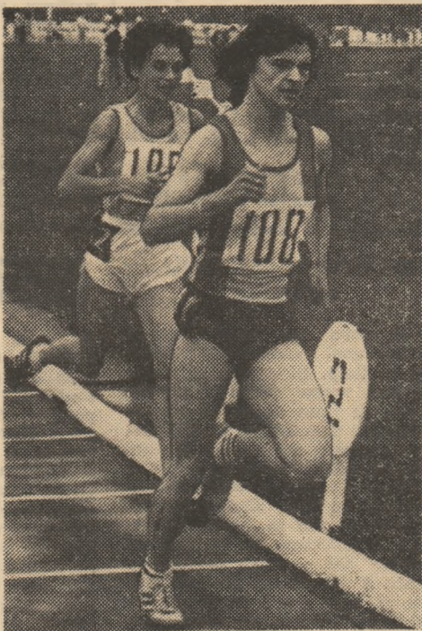
Momentul în care Paula Ivan a depășit-o pe Viorica Ghican în finalul cursei de 3 000 m