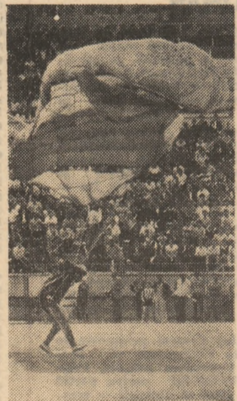
Aterizează pe gazonul stadionului din Buzău, în aplauzele spectatorilor, unul dintre performerii parașutismului nostru, maestrul sportului Vasile Mihanciu

CLASAMENTE FINALE. Acrobație, individual, 4 manșe: 1. Ramiro Nicolau (Șoimii Buzău) 34,15 s. 2. Manta Leoveanu (Transilvania I.P.A. Sibiu) 35,50 s. 3. Ion Sacană (Moldova Iași) 36,25 s.; pe echipe: 1. Șoimii Buzău 74,05 s. 2. Transilvania I.P.A. Sibiu 69,60 s. 3. Dorobanțul Ploiești 98,25 s.; punct flx, individual, 8 manșe: 1. Florian Ioniță 0,05 m. 2. Grigore Bof 0,11 m. 3. Ramiro Nicolau (toți Șoimii Buzău) 0,17 m.; pe echipe: 1. Șoimii Buzău 0,55 m. 2. Moldova Iași 1,50 m. 3. Transilvania I.P.A. Sibiu 1,71 m.; punct flx, grup de 4, 6 manșe: 1. Șoimii Buzău 0,44 m. 2. Moldova Iași 1,45 m. 3. Transilvania I.P.A. Sibiu 1,54 m.; general, individual: 1. Ramiro Nicolau 4 p. 2. Florian Ioniță 5 p. 3. Grigore Bof