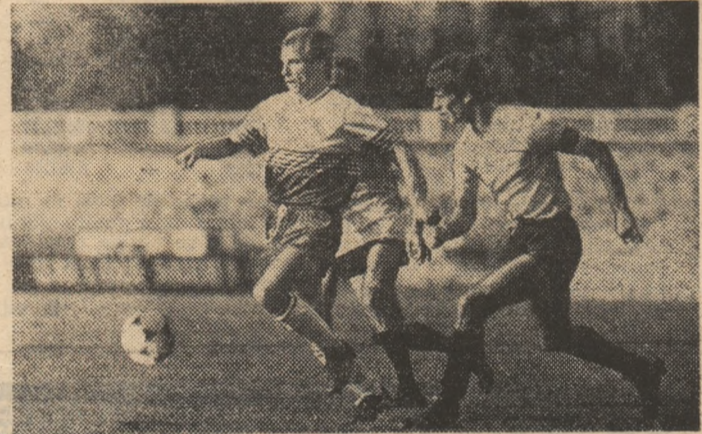
Ascensiunea Victoriei ilustrată și de împetușizitatea lui Culcear

tide din „CUPA INTERTOTO 1989”, redăm din nou meciurile înscrise în concurs, cu mențiunea că la poziția X a intervenit p modificarea asa cum s-a mai anunțat (Hannover 96, în locul echipei Eintracht Frankfurt) și I. Rapid Buc. - Öergryte IS.; II. Spartak Varna - Wisnua Aue; III. F.C. Den Bosch - Karlsruher; IV. R.F.C. Liègeois - F.C. Lucerna; V.A.C. Bellinzona - F.C. Tirol; VI. Grasshoppers - Brondby IF.; VII. Lokomotiv Leipzig - Lyngby; VIII. Djurgården - Stuttgarter Kickers; IX. Örebro S.K. - Wetzinger; X. Veje B.K. - Hannover 96; XI. Banská Ostrava - Grazer A.K.; XII. Vienna F.C. - F.C. Carl Zeiss Jena; XIII. København - B.K.C. Wastwijk.