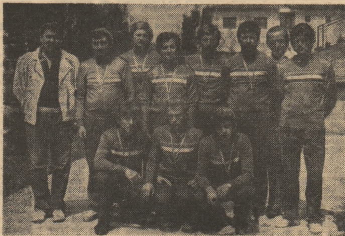
Popicarii de la Aurul Baia Mare la cîteva minute după ce au îmbrăcat tricourile de campioni

etape ale „Capei Federației“, am revăzut foile de concurs de unor întîlniri internaționale — în fine am consultat pe mai mulți specialiști și am ajuns la următoarea concluzie: în seria Nord se muncește mai mult și cu o mai mare seriozitate. Totul pornește de la antrenorii, instructorii și sportivii acestor echipe. Munca lor se întinde pe o arie mult mai mare decît strictul program de la sală. După sute de bile lansate zilnic în care se urmărește perfecționarea tehnicii, se pune accentul, în aceeași măsură, pe formarea unor jucători de nădejde. Educația acestora — tradusă prin respectarea programului de pregătire, adoptarea unui limbaj civilizât în relațiile cu adversarii, arbitrii și oficialii — este urmărită zilnic, iar orice manifestare nesportivă este sancționată ca atare. Această ambianță propice performanței am desprins-o din discuția avută cu F. Popescu, președintele Colegiului central de arbitri și un bun