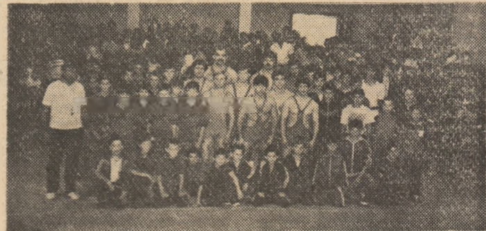
O amintire de neuit pentru micii „trîntași”. În mijlocul lor aflându-se campionii țării

dar îndeosebi al popularității de care se bucură luptele prin părțile Brașovului. Nimic surprinzător, dacă ne amintim că de aici au pornit, cu ani în urmă, un campion mondial de talia unui Valeriu Bularea, aici a luptat campionul olimpic Dumitru Pirvulescu, aici activează în prezent sportivi medaliați la diferite competiții internaționale, precum Romica