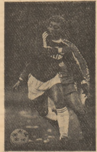
Brazilianul Romario (legitimată la P.S.V. Eindhoven) este unul dintre cei mai valoroși atacanți ai reprezentativei braziliene, fapt dovedit și duminică în meciul cu Venezuela

PENTRU a preveni manifestările nesportive în noul campionat din Italia, federația italiană de specialitate a avertizat echipele că, în cazul unor abateri ale spectatorilor de la disciplină, va sancționa foarte aspru cluburile respective. Astfel, formațiile care nu vor lua toate măsurile de ordine