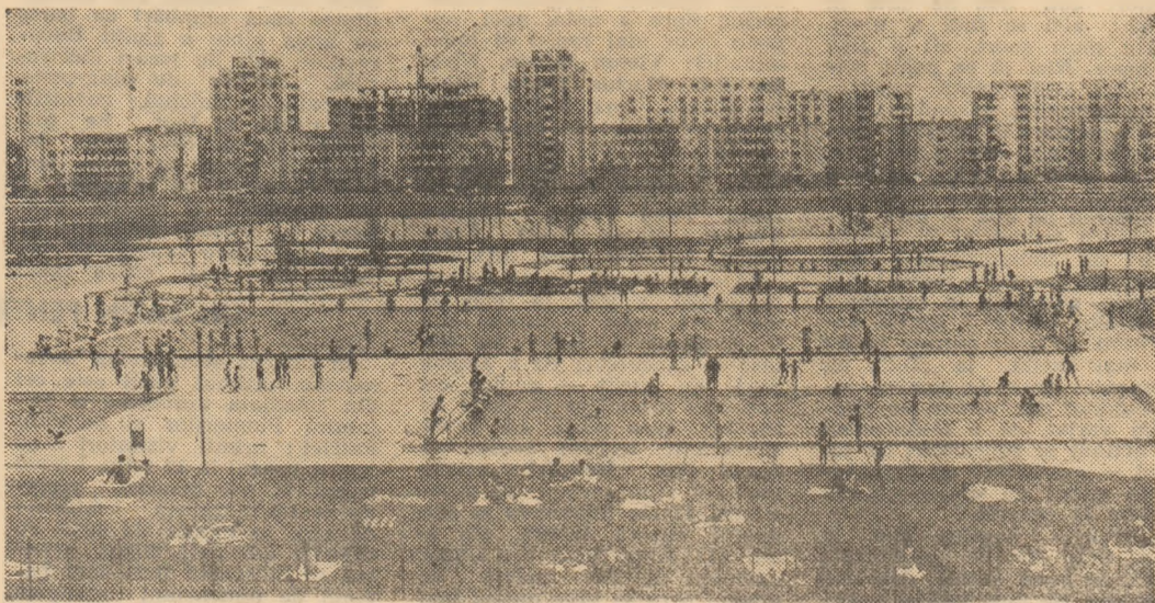
Vedere panoramică a foarte tînărului ștrand / al... tineretii - „Pionierilor”

• Ce pot face niște organizatori inspirați pentru studenți, pentru alți tineri • Necesitatea unor dotări pentru sport, pe măsura spațiului de care se dispune • Cel mai tînăr (și la propriu) ștrand bucureștean are ineditul său