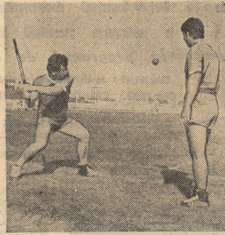
Fază caracteristică la... bătaia mingii

După cum se știe, echipa de oină aflată la „bătăie” are ca obiective principale realizarea a cit mai multe puncte suplimentare, cit mai puțini jucători loviți și menținerea grupelor în formațiile stabilite, în timp ce jucătorii de la „prinderea” mingii vor urmări să ochească maximum posibil de adversari, să prindă din zbor toate mingile bătute spre zona de trei sferturi și de fund, să descompleteze (prin „prinsul la mijloc”, procedeu descris în penultimul episod) și să împiedice formația de la „bătăie” să-și refacă grupele. Întrînd pînă acum în tainele mînuirii bastonului și a mingii de către echipe și făcînd cunoscuta cîteva din numeroasele scheme tactice, care dau întrecerilor și un plus de spectaculozitate și dinamism, în acest ultim episod ne vom ocupa de lecțiile teoretice și pregătirea psihologică de natură să contribuie la perfecționarea tuturor elementelor învățate.