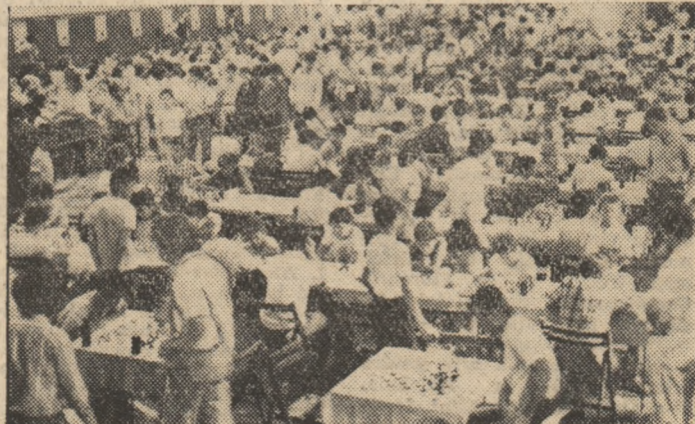
Zeci de copii, așezați la mesele de șah, într-una din zilele cele mai fierbinți ale festivalului

pionatelor Mondiale pentru copii de anul trecut, i-a primit acum pe participanții la cea de a VI-a ediție a „Festivalului internațional de șah