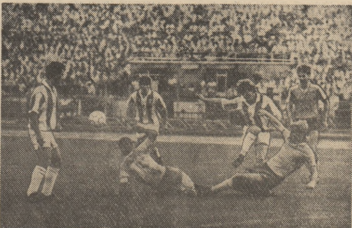
Una din numeroasele faze fierbinți create de dinamoviști (tricolori albe cu dungii) la poarta sibienilor