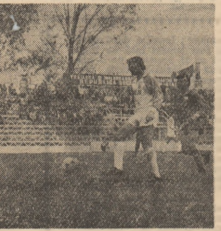
cel de al treilea gol al echipei sale

de TIRĂ (tot el fusese ocl faultat în careu de Zare). Avantajul gazdelor — care au mai ratat în această perioadă câteva bune situații de gol — va crește în min. 71, în urma unei acțiuni ofensive de mare spectaculozitate: sūt-centrare al lui TIRĂ, mingea lovește „transversala“, ricoșează la Cigan, care pasează scurt lui CORAS și acesta înscrie din apropiere. Oaspeții vor replica cu promptitudine și, după o excelentă intervenție a lui NITU la lovitura liberă executată de C. Pană III (min. 72), vor reduce din handicap în min. 78, în urma unei impetuoase pătrunderi a lui DRAGNEA. Constantin FIRANESCU