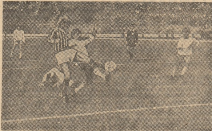
Alertă în careul lui Inter: Boar (cu tricou vărgat) va scoate în corner mingea de gol pe care Oloșutean n-a putut-o fructifica, la numai 8 metri de poartă! (Fază din meciul „Poli“ Timișoara - Inter Sibiu 2-2)