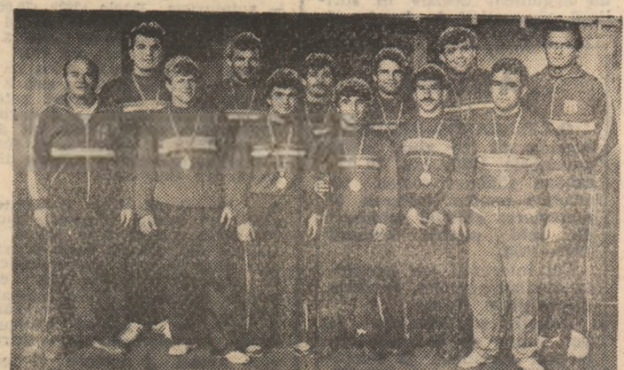
Echipe Steaua și antrenorii săi, după victoria finală la „libere”