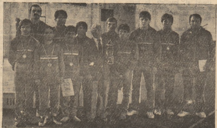
Luptătorii dinamoviști, învingători la „greco-romane”

încheindu-se cu victoria categorică a formației Dinamo București la „greco-romane” și cu succesul echipei Steaua, care s-a conturat cu destule emoții, la lupte libere.