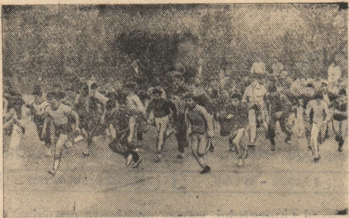
Nelipsite din activitățile sportive de masă, alergările de cros - cu trasee excelente așezate în incinta Parcului Tineretului - au reținat interesul pentru această probă atletică a mii și mii de tineri și tinere

9.400; cat. C.S.S. 1 T C.S.S. V 215.400, 3. 215.200, 4. 5. C.S.S. C S.S. Buz 4 4 comp (C.S.S. 1 C (Timișoara) 5 mic (C.S.S. Sil (Timișoara) 5 54.350, 5. Vîltorul C Toader To la Mare) rate: sol: min Bogd 9.150, 3. Bala Mare 9.725, 3. Kovacs (C inele: 1. 9.150, 3. 1. Lerie f Remus D soara) 8.7 gan 8.425, corici 9.1 Andrei N Mare) 9.1 (C.S.S. 3