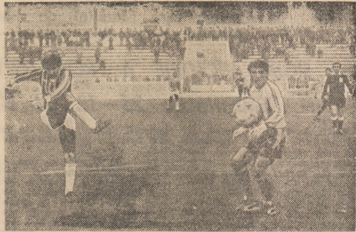
Vășil deschide seria golurilor lui F.C. Inter și a celor trei pe care le-a realizat în partida de miercuri, cu F.C. Olt