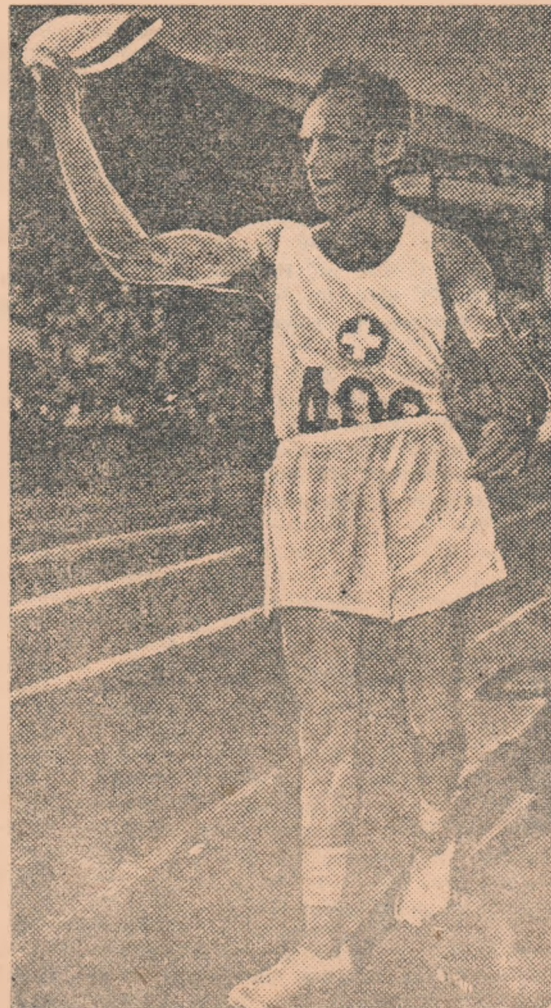
Fritz Schwab campion european la 10 km. marș

Prezînd performanțele citorva dintre atleții care se vor întrece peste cîteva zile pe stadionul Republicii, începem o săptămînă în care iubitorii acestei discipline, atît din Elveția cît și din țara noastră, se preocupă de lupta care se va naște pe pistă, la locurile de sărituri și aruncări, în cele două zile de concurs.