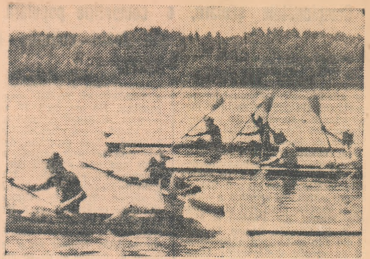
Trei echipaje ale asociației Locomotiva, în plin efort