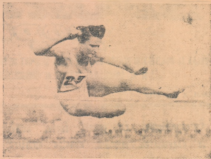
O concurentă din finala Spartachiaei satelor din anul 1953, trecind stacheta la săriura în înălțime.

Nivelul calitativ la care se desfășoară întrecerile Spartachia-