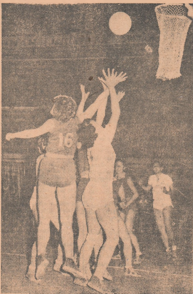
În lupta sub panou între jucătoare de talie egală, este avansată jucătoarea cu detentă mai bună. Acest fapt este bine ilustrat în fotografie, unde se vede că jucătoarea cu numărul 16 va câștiga mingea. (Fază din meciul Locomotiva Sofia — Progresul, disputat anul trecut).

Insistăm asupra pregătirii fizice. S-a vorbit și s-a scris în nenumărate rânduri despre această principală problemă a baschetului feminin, încît nu credem că mai