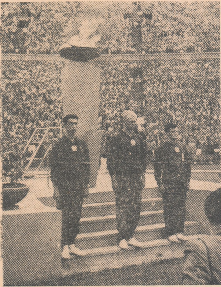
Un moment solemn: flacăra Jocurilor Mondiale Universitare a fost aprinsă. Aspect de la deschiderea I.M.U.V.