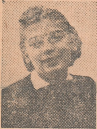
IOLANDA BALAȘ, campioană mondială universitară la saritura în înălțime.

îmbunătățind cîteva dintre ele. Alergatoarele din R.D. Germană au deținut supremația în probele de viteză ale concursului de atletism din cadrul Jocurilor. Atleții sovietici și cei maghiari au dat o prețioasă contribuție la alcătuirea unor tabele cu rezultate superioare, iar scrimerii maghiari și polonezi, alături de reprezentanții noștri, au făcut ca întrecerile lor să amintească de concursurile olimpice și recentele campionate mondiale. Neîntrecuta măiestrie a gimnaștilor sovietici nu a fost redată numai de clasamentele generale, ci și de admirația fără rezerve a tuturor participanților și a specialiștilor prezenți. Și în această ramură de sport am avut satisfacția unei frumoase comportări din partea gim-