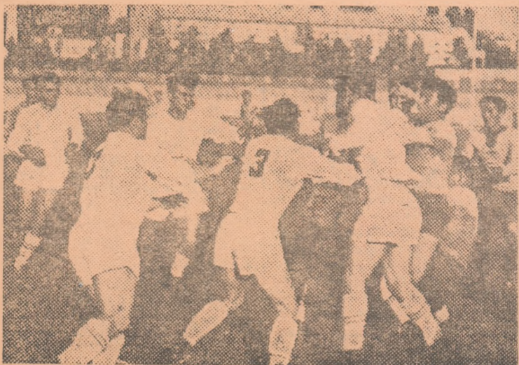
Echipele C.C.A. și Dinamo grupează în rîndurile lor mulți jucători frunțași. Iată aci o fază dintr-o întîlnire de anul trecut, între aceste formații.