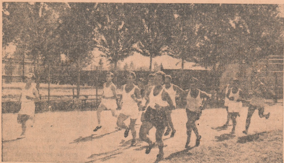
Un aspect dintr-o cursă disputată cu prilejul unui concurs athletic care s-a desfășurat la Timișoara în cadrul Spartachiadei satelor.

Întrecerile au fost urmărite de un mare număr de spectatori și au constituit cu adevărat prilej de întărire a prieteniei dintre sportivii de la orașe și sate.