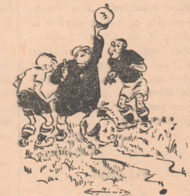
— Un moment vă rog...

Că terenul de fotbal al colectivului sportiv Locomotiva Bacău a rămas pe ici pe colo — de fapt, prin... părțile esențiale, — complet neimprejmuat ar fi și n-ar fi cea mai mare nenorocire. Lucrul poate fi făcut repede, fără prea multă cheltuială și, pînă atunci, un apel către publicul spectator ar putea ușura situația. Iată însă că prin mijlocul terenului, acolo unde gazonul a