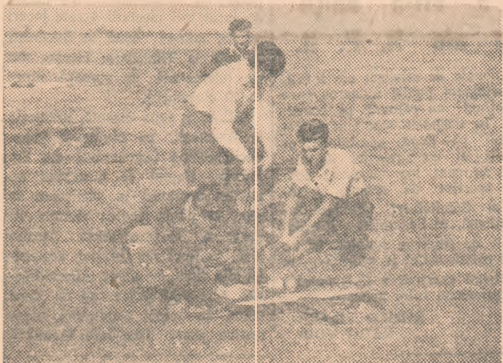
Un aeromodel de viteză înaintea de a lua startul.