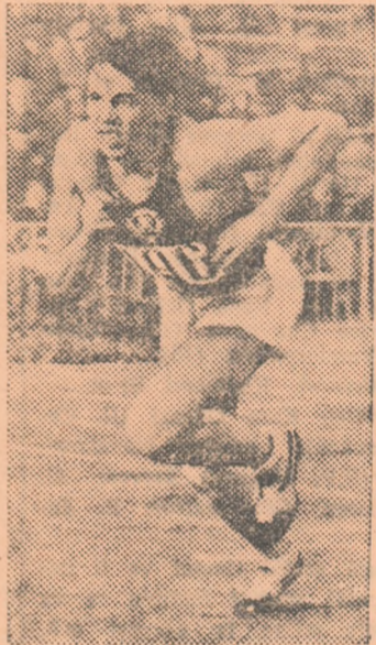
Ardalion Ignatiev pornește în cursa de 400 m. Timpul său pe această distanță este cel mai bun din lume în actualul sezon athletic.

Din nou Ardalion Ignatiev s-a dovedit unul din cei mai buni specialiști mondiali ai sprintului prelungit. El a alergat 200 m. în 21,1