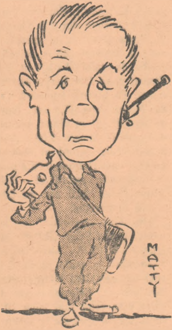
Odd Sannes (Norvegia)

Încă din prima zi, cea de mine 3 octombrie, la ora 10, în pro-