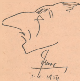
Francesco Linari (Italia) și-a făcut, pentru ziarul nostru, propria caricatură.

Deși sînt numai 9 participante în proba feminină de armă liberă