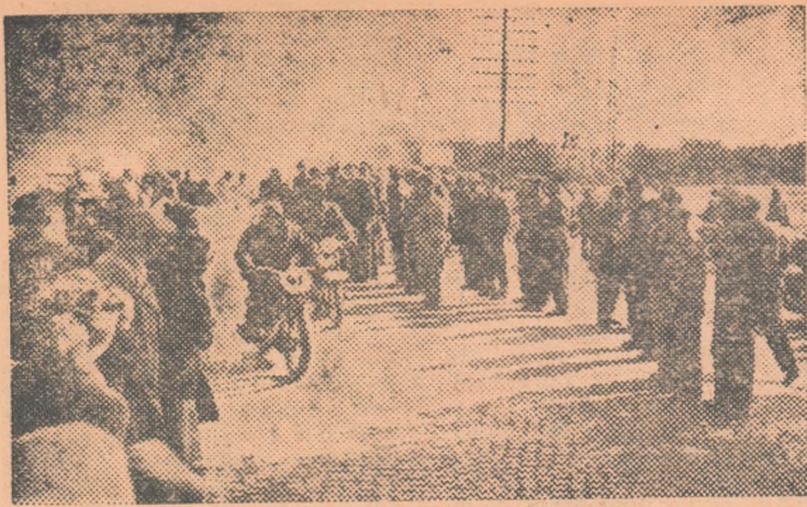
Peste câteva minute, motocicliștii vor porni să străbată cei peste 3.000 de km ai Circuitului R.P.R. Iată-i îndreptându-se spre locul de start