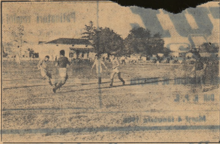
Ca în toate celelalte orașe, și în orașul Botoșani, fotbalul se bucură de o largă popularitate, sute de tineri practicând cu drag acest spectaculos sport.

Dumejina, pentru prima oară, prin părțile Botoșanilor, te întrebă cu o ușoară urmă de îndoielă, cit de numeroase vor fi însemnarile cu privire la prietenile pe care le-a legat sportul în aceste meleaguri despre care se mai spune, uneori, că nu au o „tradiție” sportivă. Câteva zile potrecute prin astfel de așezări, lipsite de „tradiție” cer însă, apoi tot atâta timp pentru a povesti despre frumoasele realizări obținute aici, despre oameni și faptele lor. Și poate timpul acesta nu va cuprinde decât crâmpele din rodnică activitate sportivă pe care o poți întâlni în Botoșani, în numeroase alte orașe în care oamenii făuresc o tradiție mai nouă, tradiția prieteniei oamenilor muncii cu stadionul, cu aerul proaspăt al pădurilor la marginea cărora se desfășoară întrecerile de cros, prietenia cu sportul, datorită de sănătate, de noi forțe de muncă și voințe.