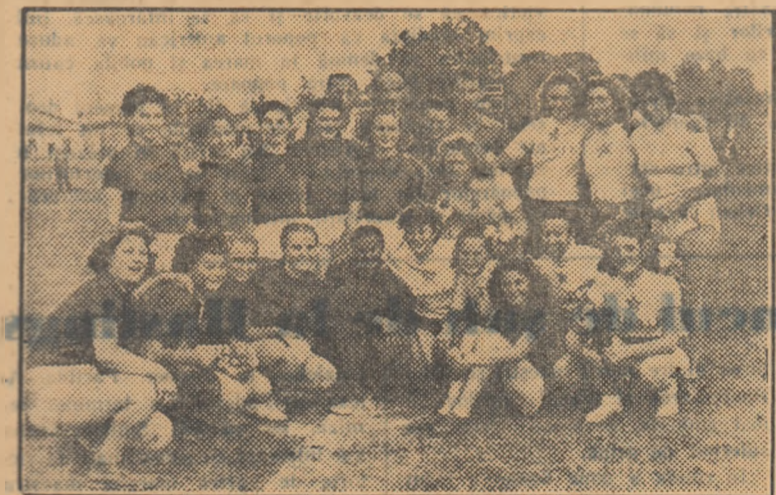
Muncitorii și muncitoarele de la uzina textilă „Moldova” se mîndresc cu echipa feminină de handbal a colectivului sportiv Flamura roșie, care a obținut numeroase victorii în întîlnirile susținute.