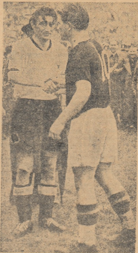
Fritz Walter (stînga) căpitanul echipei de fotbal a Germaniei Occidentale primeşte felicitări de la Ferenc Puskas, căpitanul reprezentativei R. P. Ungare, după finala campionatului mondial, disputată pe stadionul Wankdorf din Berna.

primul loc se află Turbine Erfurt, la egalitate de puncte cu Dinamo Berlin. Amîndouă aceste echipe au acumulat cîte 17 puncte. Pe locurile următoare se află echipele Aktivist Brieske, Lokomotiv Leipzig, Wismut Karl Marx Stadt, cu cîte 15 puncte. Toate aceste echipe păstrează cele mai mari şanse în lupta pentru primul loc.