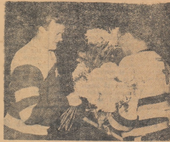
Vsevolod Bobrov, căpitanul reprezentativei de hochei a Moscovei schimbă flori cu Ekslein (K.E.V.) înaintea meciului câștigat de sportivii sovietici cu 6-0, la Berlin.

Amatorii de hochei din lumea întreagă așteaptă cu nerăbdare să afle noi isprăvi minunate ale acestui sportiv excepțional. Și fără îndoială că Bobrov va avea un cuvînt greu de spus la viitoarele campionate mondiale, în care reprezentativa Uniunii Sovietice își va apăra titlul de cea mai bună echipă din lume.