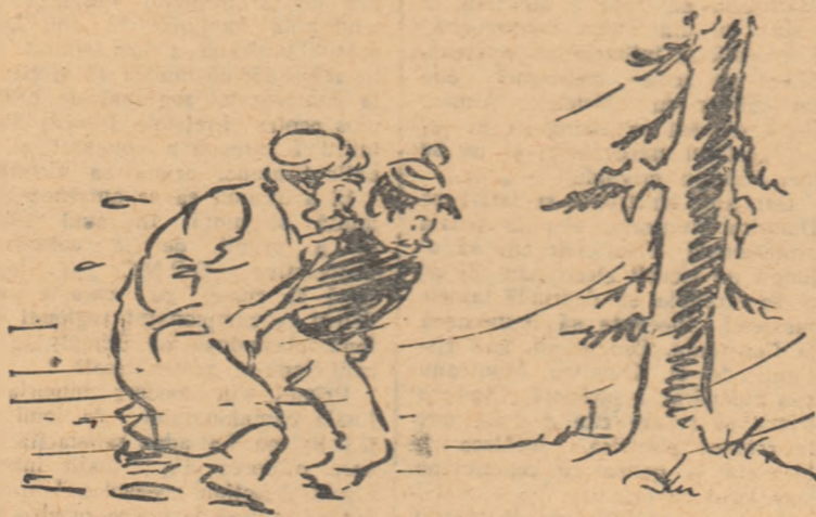
— Pînă să trecem odată norma la obstacole, ne-am luat de zece ori norma la marș...

Un alt aspect negativ al activității de cultură fizică și sport din raionul Tg. Neamț este felul în