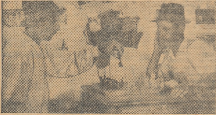
Timpul trece plăcut la căminul cultural în jurul mesei de șah...