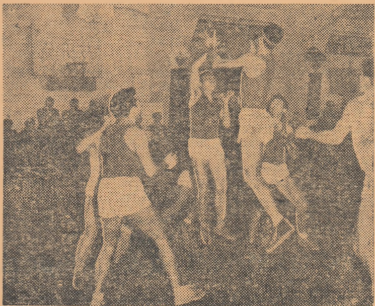
Fază din meciul Știința I.C.F. — Voința

Toate permisele de intrare la manifestațiile sportive trebuie predate secretariatului C.C.F.S. pentru a fi vizate pe anul 1955.