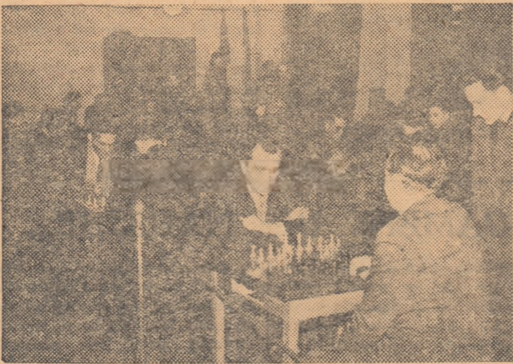
Zeci de tineri și vîrstnici, membri ai colectivului sportiv „Locomotiva” Ministerul Căi Ferate se întrec cu drag în concursurile de șah organizate în cinstea alegerilor sportive sindicale.

În concluzie, este necesar ca problema mobilizării concurenților la crosul de masă „Să întîmpinăm 1 Mai” să stea în centrul preocupărilor colectivelor sportive, iar primele acțiuni în acest sens să fie pornite încă de pe acum.