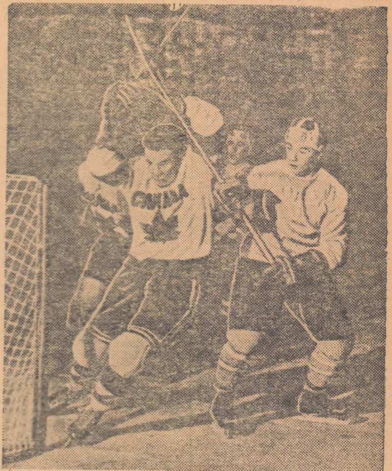
Un tăietor de lemne? Nul Un jucător canadian atacă într-o poziție caracteristică hocheiștilor de peste ocean. Cum rămîne însă cu premiza din regulament care spune că „crosa nu poate fi ridicată mai sus de înălțimea umărului”?

Anuș acesta onoarea „frunzei de pălîn” va fi apărută de echipa „Penticton Vees”. Această echipă se bucură de cea mai mare popularitate în Canada. Din cele 61 de întîlniri