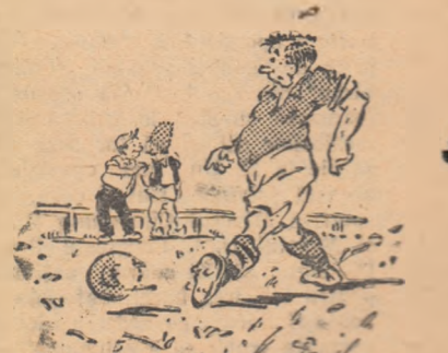
Cînd îi vîd cît sînt de ocupați, ce să-i mai deranjez și eu cu G.M.A.-ul...

Consiliul colectivului, care a fost de curînd reorganizat, are datoria să curme această situație nejustă.