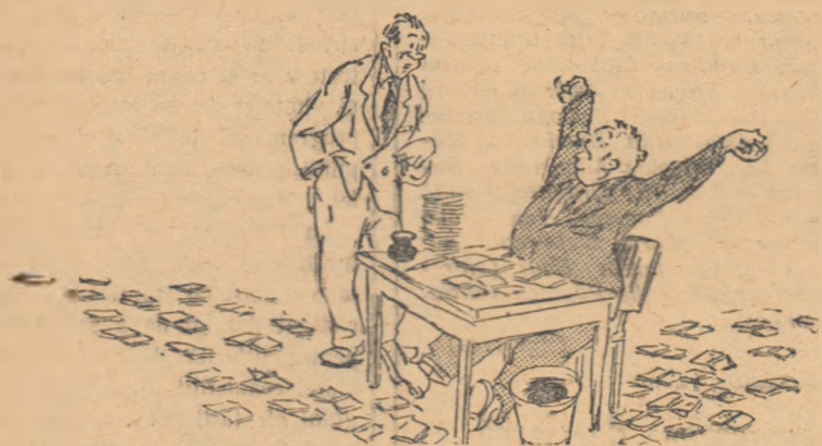
— Stii că am obosit? — Ce-i glumă să treci normele pentru 45?

Luînd drept pildă munca plină de elan dusă în unele colective sportive, orașe și regiuni, activiștii din comisiile de pregătire și examinare G.M.A., din comisiile orașenești și raionale de control și din comisiile regionale G.M.A. au datoria de a lupta fără cruțare împotriva formalismului în munca G.M.A., pentru noi succese numerice și calitative în această muncă, în anul 1955.