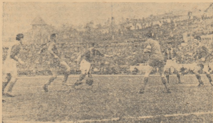
Ozon încearcă să pătrundă spre poarta lui Toma, Bone, Apolzan și Onisie sint însă gata să intervină. Fază din jocul Progresul București — C.C.A.