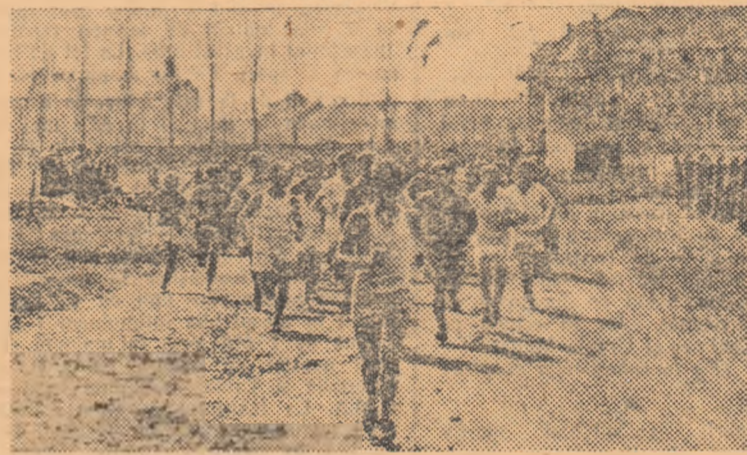
Aspect din întrecerea juniorilor de categoria I-a, în etapa pe oraș, la Timișoara.