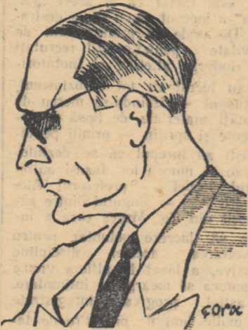
René Pillon Văzut de Gora

slărimat, paturile rămîn uneori intacte... In momentul cind m-am reintors in camera mea, in mare parte distrusă, cu mobilele slărimate, perdelele rupte in bucăți, candelabruI căzut pe podea, am văzut cu surprindere că pe masă tabla de șah rămăsese absolut nemiscată, poziția pieselor nu se modificase, numai o pulbere ușoară acoperia lemnul, ca o decorație rafinată... Am rămas pe ginduri in fața acestui spectacol, lată, imi spuneam, micul joc de șah nu voise să participe la grozăviile războiului! De atunci, m-am gîndit mereu că providența făcuse ca masacrul nostru fără drept de apel să fi fost evitat tocmai pentru că jucam pașnic o partidă de șah, in momentul cind amenințarea căzu asupra noastră... Asemenea distrugerii fulgerătoare, asemenea suferințe impuse unei populații reprezintă o soartă crudă. La unsprezece ani după această groaznică întimplare trăită de mine, perspectivele sint și mai întunecate. Forțele armate au acum posibilitatea, prin bombe cu energie nucleară, să suprime orice viață pe o rază de zeci de kilometri și pentru luni de zile. Aceasta face războiul de-a dreptul de neconcepțibil și ni-l arată ca o adevărată crimă împotriva umanității. Tocmai de aceea, idealul nostru de jucători de șah, joc pașnic prin excelență, capătă un loc de frunte in acțiunea de întărire a prieteniei între popoarele lumii.