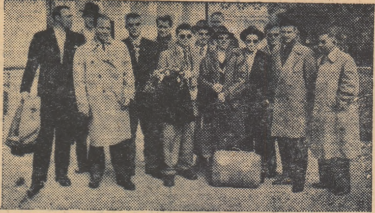
Lotul boxerilor suedezi la sosirea în Capitală.