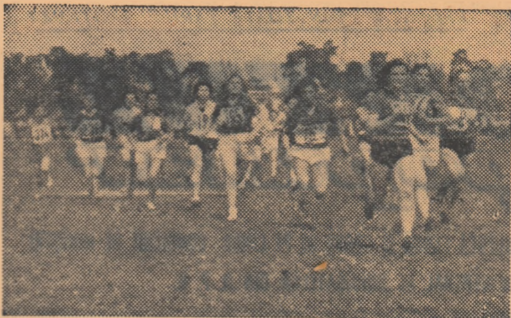
Un aspect din cursa juniorilor