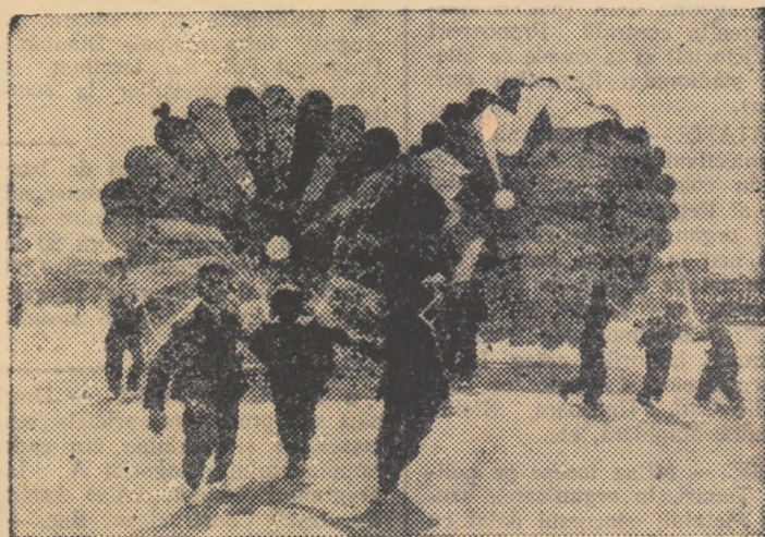
Parașutismul, sportul celor cu rașoi, și-a cucerit în rîndurile tîneretului nostru o mare popularitate. Imbrăcați în costumele de salt, parașutiștii au trecut prin fața tribuilor nărdind imense și multicolore parașute.