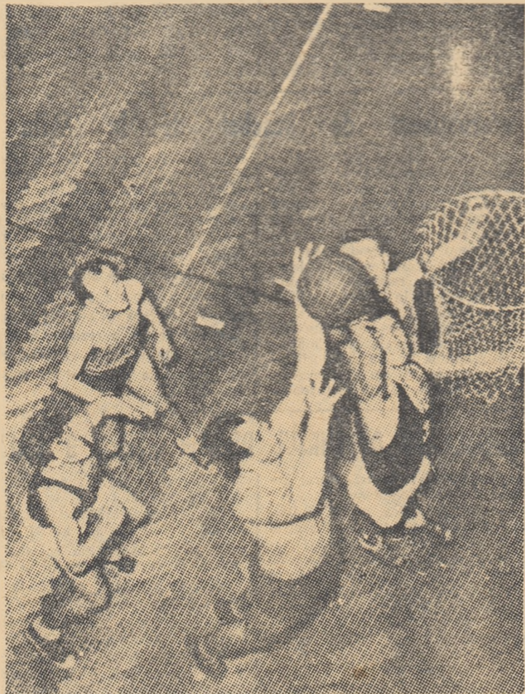
Baschetul este unul dintre cele mai populare sporturi din R. Cehoslovacă.

Pregătirile în vederea acestui însemnat eveniment au început încă din ianuarie 1955. Programul Spartachiadei este bogat și variat. Întrecerile, așteptate cu multă nerăbdare, vor începe la 20 iunie, când se vor desfășura competiții rezervate tineretului, la următoarele discipline sportive: atletism, gimnastică, voley, baschet, ciclism, lupte și natație. Seniorii se vor întrece în plus la