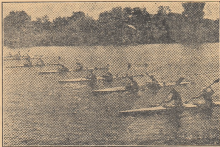
Un start în proba de caiac dublu, la un concurs desfășurat pe lacul Snagov.