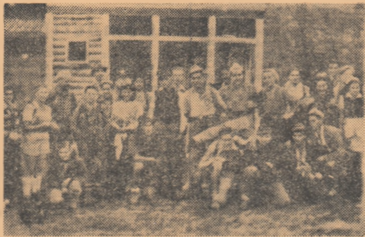
La cabana Căsoia-Arad. Grupurile de turiști sînt gata de plecare

Concursul va avea diferite grade de dificultate care vor crește de la o etapă la alta. Astfel, prima etapă va fi de gradul I dificultate cu temă de zi; etapa a II-a va fi de grad. II dificultate cu temă de zi și de noapte, iar etapa a III-a va fi de grad. III dificultate cu trei teme de zi, două teme de noapte și probe G.M.A. gr. II cu caracter aplicativ.