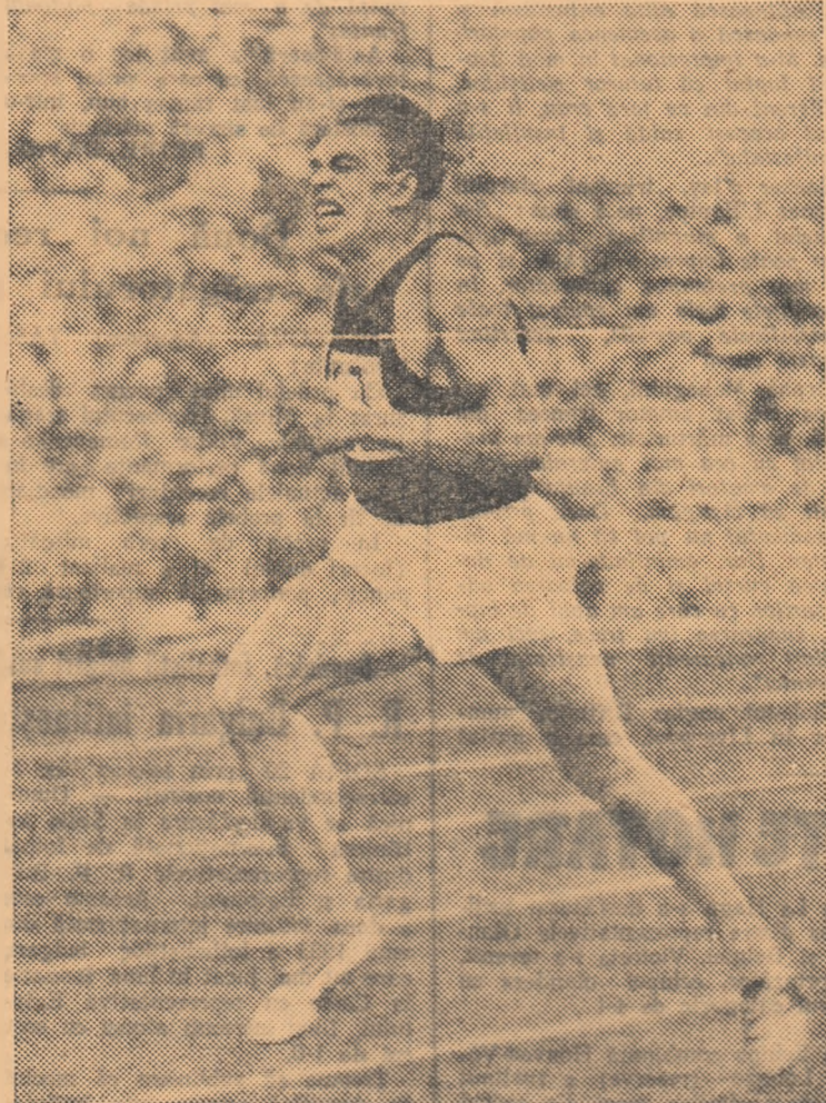
Ardalion Ignatiev, campion al Europei pe 400 m. plat — la finisul unei curse. —

Din această scurtă trecere în revistă se poate vedea că pregătirile făcute de sportivii sovietici în vederea Jocurilor de la Varșovia sînt intense și încununate de succes. Evoluția în întreceri a sportivilor sovietici va ridica, fără îndoială, la un nivel tehnic excepțional această competiție, la care și-au anunțat participarea mulți dintre cei mai valoroși sportivi ai lumii.