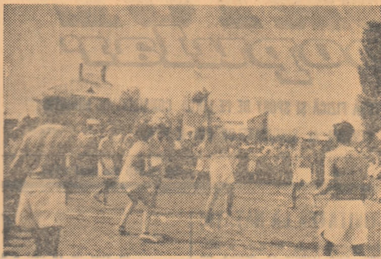
Întrecerile de volei din cadrul Concursurilor Sportive ale Tineretului dau unor mase largi de tineri posibilitatea să practice voleiul.

■ În regiunea Arad au început de curînd întrecerile din cadrul Concursurilor Sportive ale Tineretului. Comisia regională de organizare a competiției a luat din timp o serie de măsuri în vederea bunei desfășurări a concursurilor. Astfel, membrii comisiei regionale au fost repartizați pe raioane, pentru a putea îndruma și controla efectiv munca de organizare a competiției. De asemenea, comisia regională a luat inițiativa de a include, pe lângă ramurile sportive, cuprinse în regulament, alte discipline sportive,