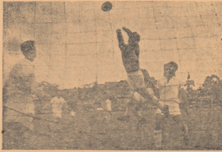
Fază din jocul dintre echipele de tineret Flacăra Ploiești și Progresul București. Mulți dintre fotbalistii acestor echipe participă la competiția „Cupa de vară”.

Marți 24 mai, Stadionul Republicii: Selecționata divizionară B-Wiener Sportklub (ora 17.30), arb. S. Segal. În deschidere la ora 15.30: Selecționata Tineretului-Progresul București (tineret).