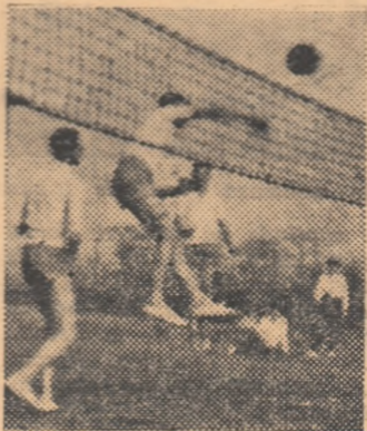
Lată-i pe elevii școlii profesionale în timpul unui antrenament de volei.

comisi specială de organizare. Fiecare clasă capătă la începutul întrecerii cite o sută de taloane de culoare albă. Sarcina fiecărui elev din clasa respectivă este să asigure păstrarea acestor taloane și, dacă se poate, să adauge la ele din cele de culoare roșie care se acordă pentru succese deosebite. Se întîmplă uneori ca taloanele albe să se împuțineze, fie din pricina disci-