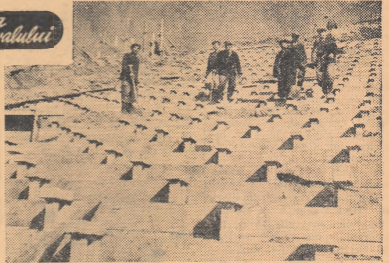
Se montează gradenele tribunelor noului stadion din Varșovia.