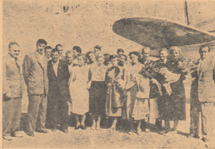
Echipele de volei ale Uniunii Sovietice la sosirea pe aeroportul Băneasa.