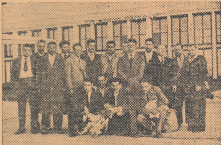
...La cîteva ore după aceea, a aterizat avionul care a adus echipa masculină a Franței...