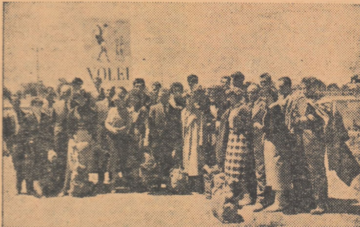
Simbătă la prinz au sosit jucătorii și jucătoarele reprezentativelor Republicii Cehoslovace...

Noi echipe participante sosite în Capitală