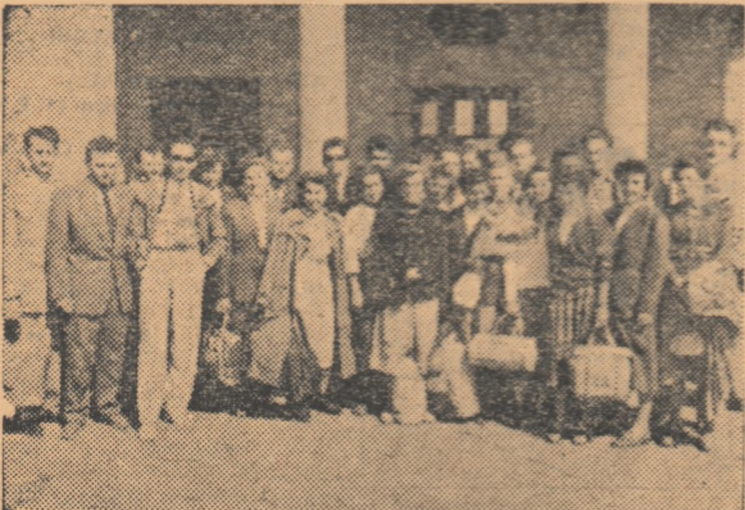
Iată-i pe voleibaliștii și voleibalistele maghiare la sosirea în Capitală