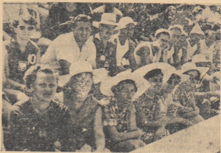
Voleibaliști și voleibaliste din echipele R.P. Ungare, R.P. Polone, R.P. Bulgaria și R.P. Romina în tribuna sportivilor

lupta a fost dramatică și pentru cele trei puncte câștigate de jucătorii jugoslavi au fost necesare numeroase schimbări de servicii și aproape 20 de minute de joc. Victoria finală a revenit echipei R.P.F. Jugoslavia, care în afară de o combativitate remarcabilă, o pregătire fizică excelentă (mobilitate și viteză), a arătat de astă dată și o bună executare a blocajului și un joc de atac cu multă variație. Jucătorii noștri au luptat cu multă înșulțire, învingind numeroase momente critice. Au greșit însă tactic prin lipsa de variație în acțiunile ofensive, și în special, nefolosind loviturile de atac din prima pasă, care atunci cînd au fost utilizate s-au dovedit eficiente. De asemenea, ei au greșit neatacînd în