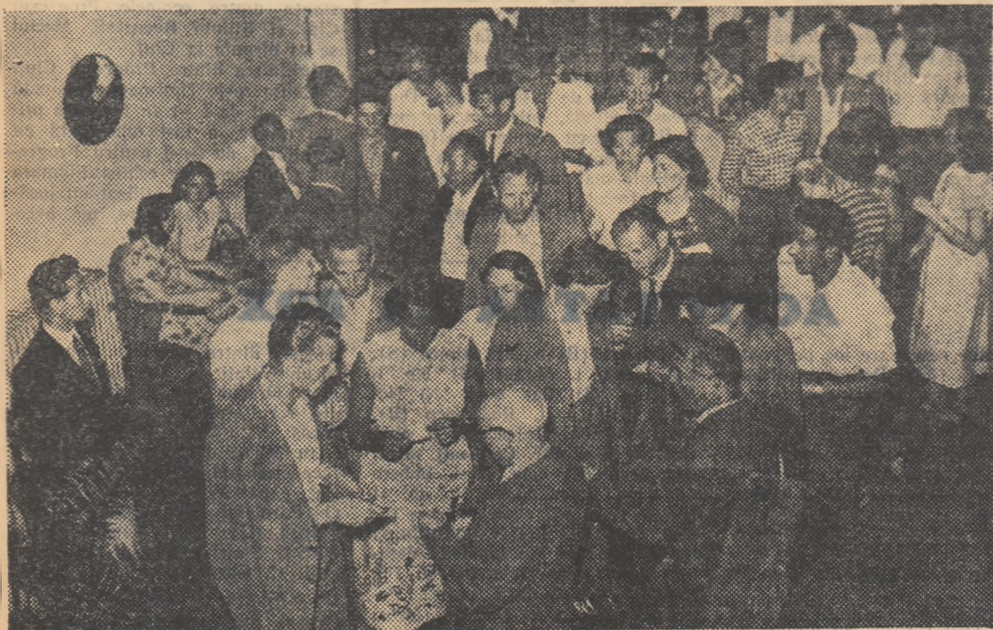
Ieri după amiază oaspeșii noștri sportivi au participat la un spectacol de muzică ușoară dat în cinstea lor de Ansamblul de Estradă al R.P.R. Iată-i pe voleibaliști și voleibalistele în holul sălii „Libertatea”, unde a avut loc spectacolul.

„După-amiază, în sala Libertatea, toți participanții la campionate s-au reunit pentru a asista la spectacolul dat în cinstea lor de Ansamblul de Estradă al R.P.R. Programul, în cadrul căruia și-au dat concursul cei mai buni artiști și cîntărești de muzică ușoară ai Capitalei, a cunoscut un deosebit succes, fiind îndelung aplaudat. Seara, jucătorii și jucătoarele s-au reîntors la hotel plini de vole bună, după o zi petrecută în mod plăcut, în care au avut prilejul să-și cunoască mai bine gazdele și, așa cum mulți au mărturisit-o, să se prefacă ospitalitatea.